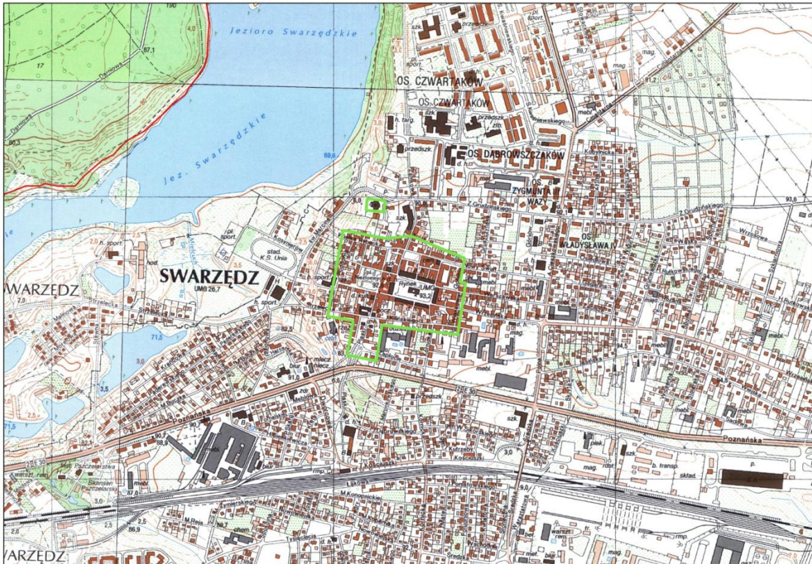
Zabytkowy układ urbanistyczny miasta Swarzędza (zaznaczony zieloną linią)

zachodniej części założenia urbanistycznego miasta, czego przykładem są budynki stojące w zachodniej pierzei placu Niezłomnych (wytyczonego w XVII wieku), Mała Rybacka, Ogrodowa (patrz załącznik graficzny poniżej).